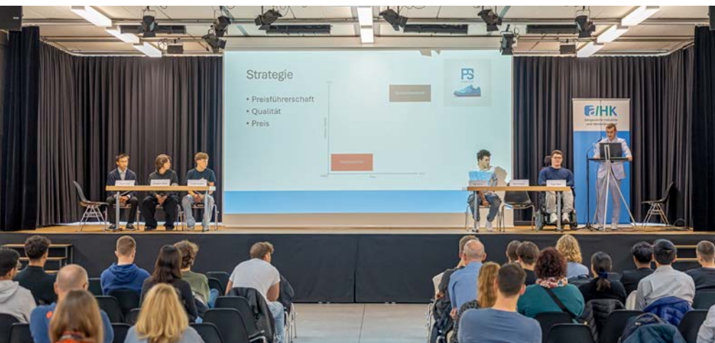
Am letzten Tag der Wirtschaftswoche präsentieren die Schüler der Informatikmittelschule an der Kanti Baden den Aktionären an der Generalversammlung ihre Geschäftsergebnisse.

Im Oktober fanden an gleich drei Kantonsschulen Wirtschaftswochen statt. Mit der Projektwoche vermittelt die AIHK den Schülerinnen und Schülern praktisches Wissen und fördert ihr Verständnis für wirtschaftliche Zusammenhänge. Ein Augenschein in Baden.