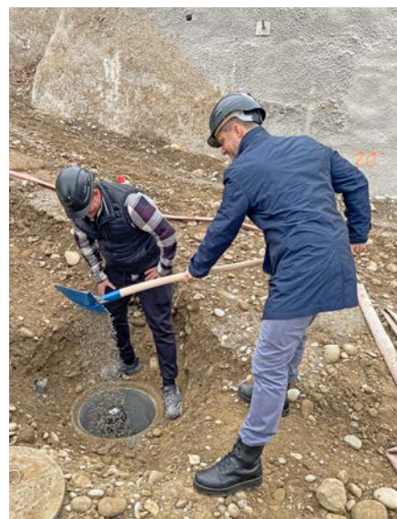
Der AIHK Direktor versenkt mit dem Bauleiter die Zeitkapsel, welche unterhalb der Wendeltreppe positioniert sein wird.

Die Grundsteinlegung hat die nächste Bauphase eingeläutet. Bis im kommenden Frühling soll der Rohbau abgeschlossen sein. Der Bezug der neuen Büroräumlichkeiten durch die insgesamt rund 30 Mitarbeitenden von AIHK und Ausgleichskasse ist für den Frühling 2026 geplant. Das «Haus der Wirtschaft» wird nicht nur