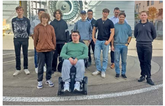
Die Teilnehmer der Kanti Baden besuchten in der Wirtschaftswoche das AIHK Mitglied Accelleron.

Auch hier haben die Absolventen ein Produkt ausgewählt und sind für eine Woche in die Rolle einer Geschäftsleitung geschlüpft.