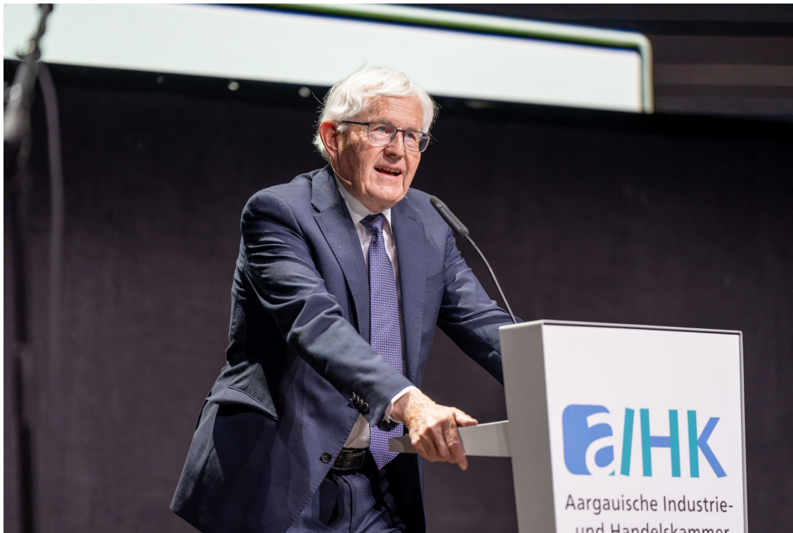
Alt-Bundesrat Kaspar Villiger hielt das Jubiläumsreferat unter dem Titel «Vergangenheit darf man feiern, Zukunft muss man erarbeiten».