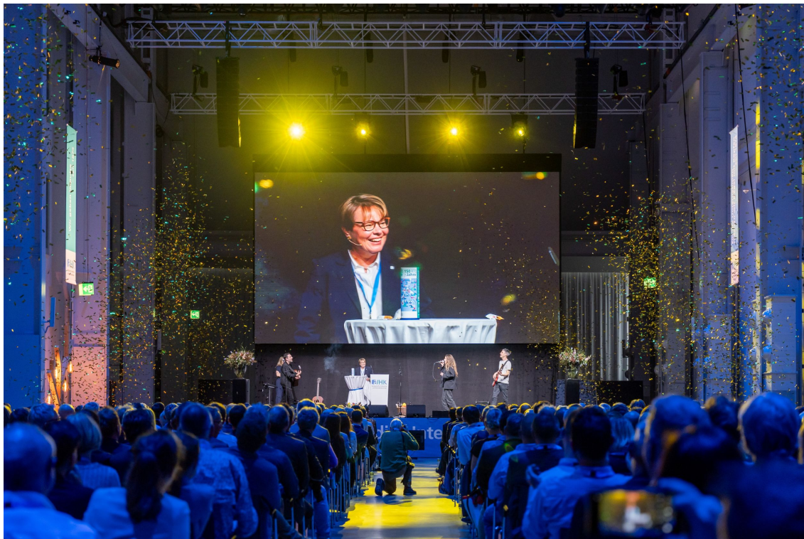
Mehr als 650 Gäste nahmen an der Jahresversammlung der AIHK teil und feierten gemeinsam den 150. Geburtstag des Wirtschaftsverbands.