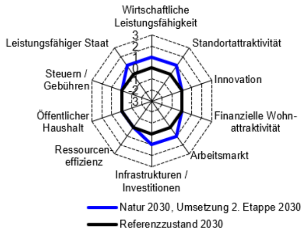
Abbildung 2: Wirkungen des Vorhabens in der Dimension Wirtschaft. Positive Punktzahlen entsprechen einer Verbesserung gegenüber dem Referenzzustand, negative einer Verschlechterung.